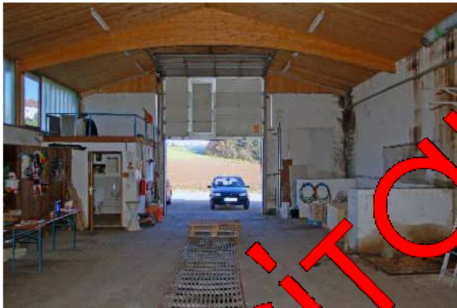
Αποθήκη πόρτα κυλίνδρου