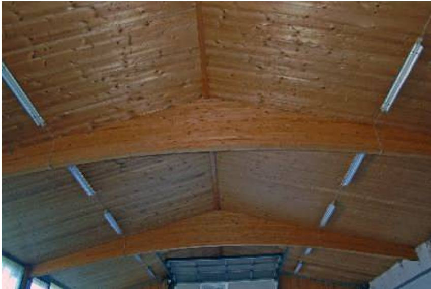
Νέο ανώτατο όριο