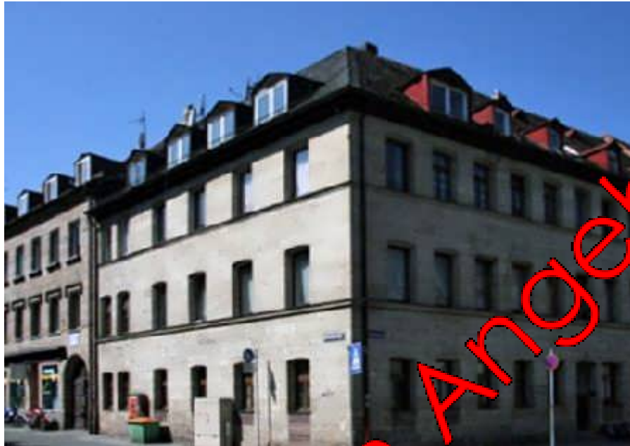
Vor der Sanierung