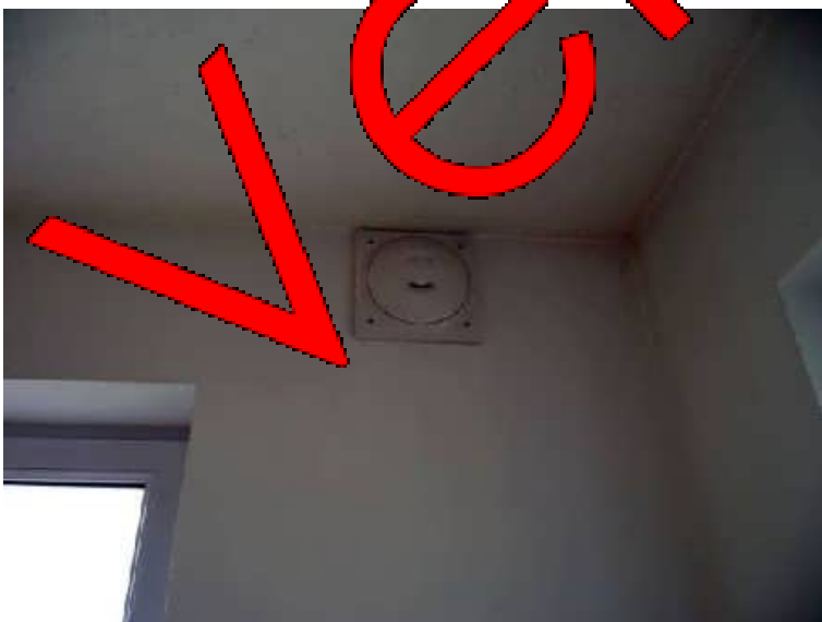
Autom. Belüftung mit Rückgewinnung