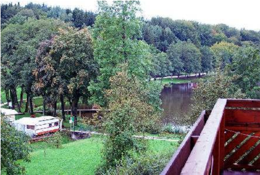
Blick von dem Balkon