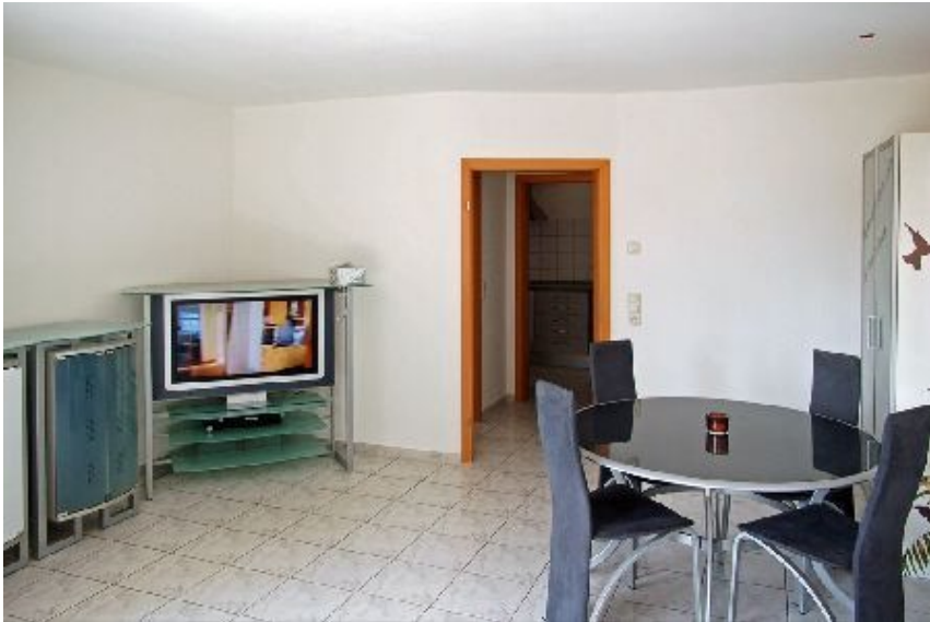
Essecke im Wohnzimmer