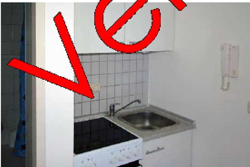
Küchenzeile in der Diele