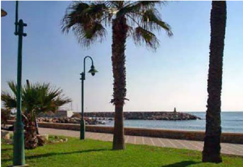
Promenade von Villaricos