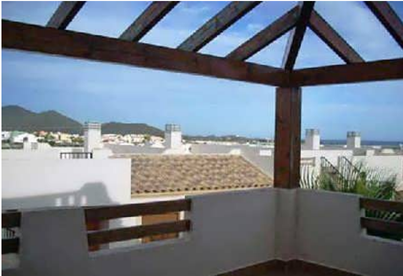
Blick von der Dachterrasse