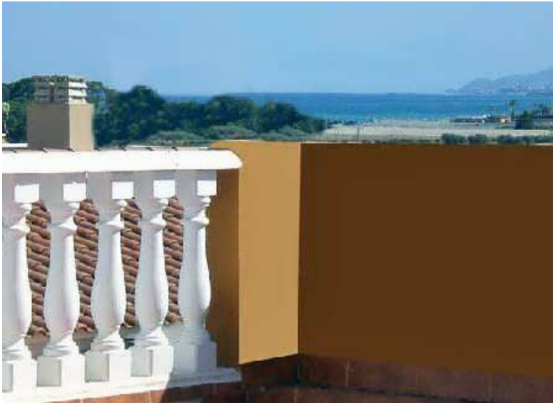
Blick von der Dachterrasse