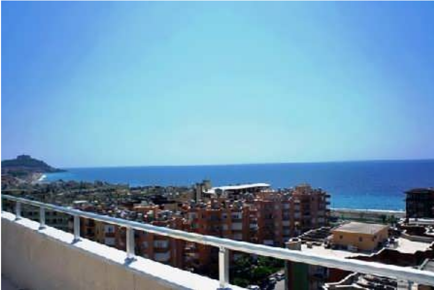
Blick von dem Balkon