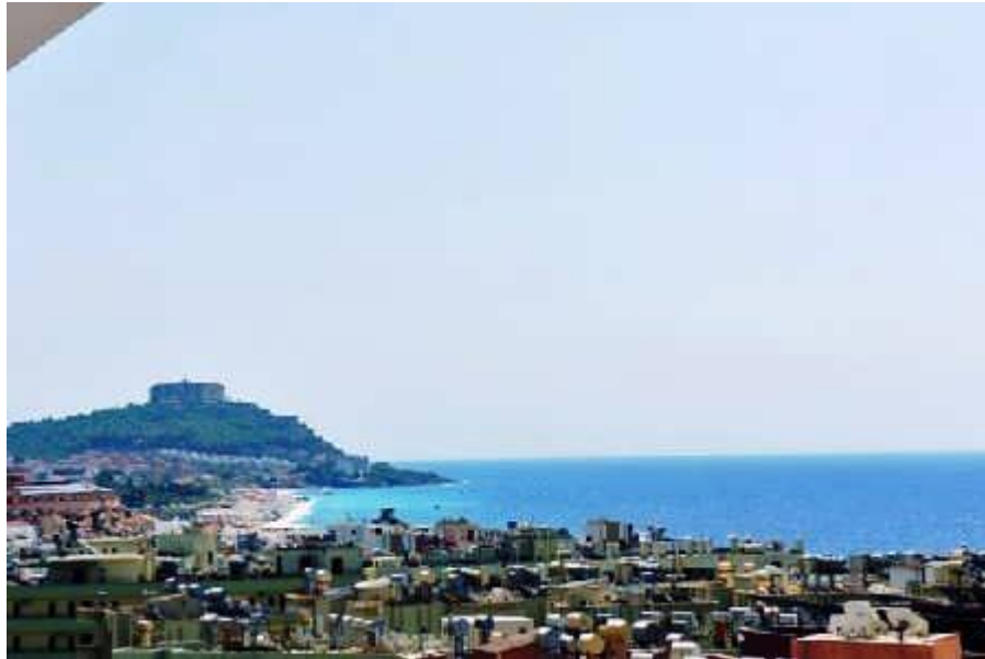
Alanya mit seiner historischen Burg