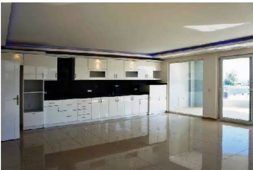
Wohnzimmer mit Kochnische