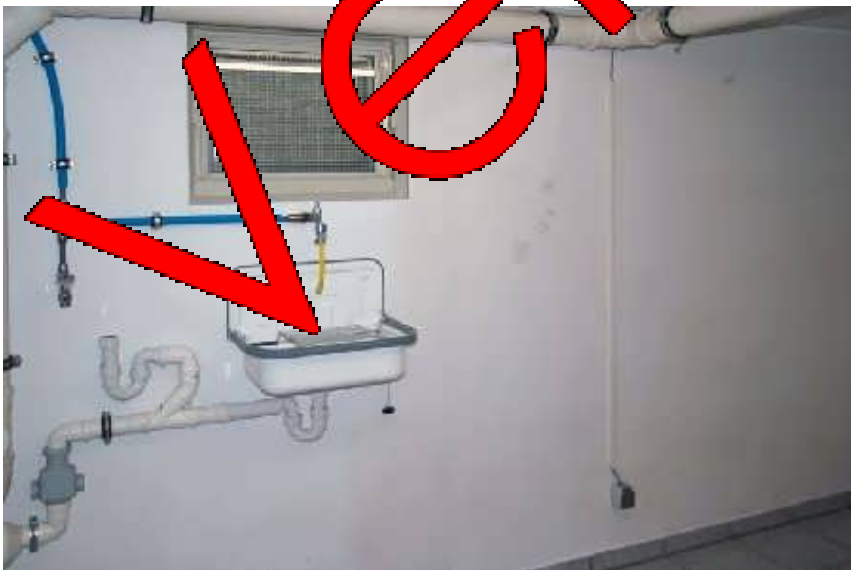
Anschluß für Waschmaschine im Keller