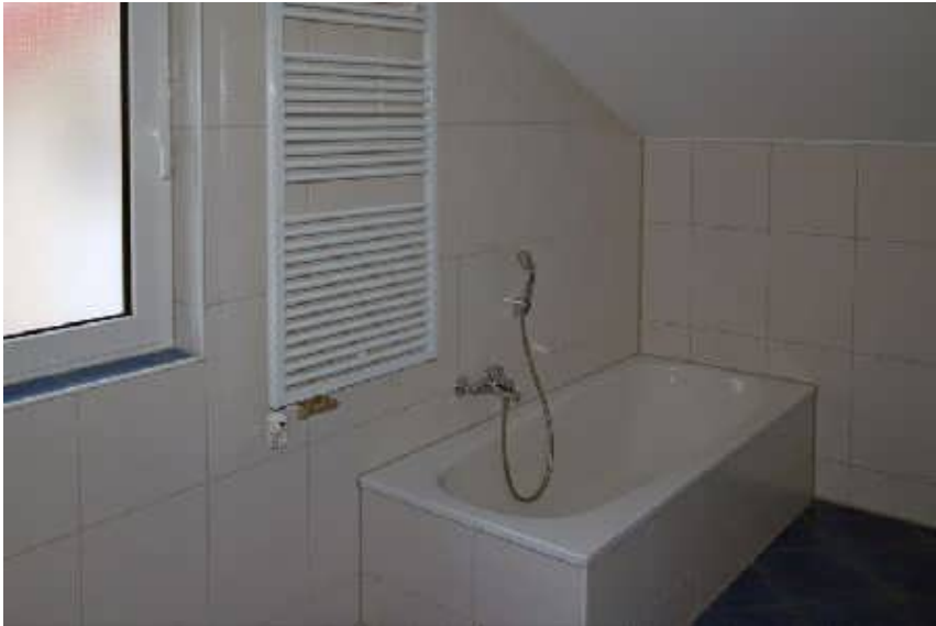
Bad im Obergeschoss