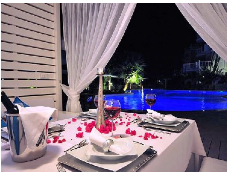
Ihr Tisch ist schon gedeckt