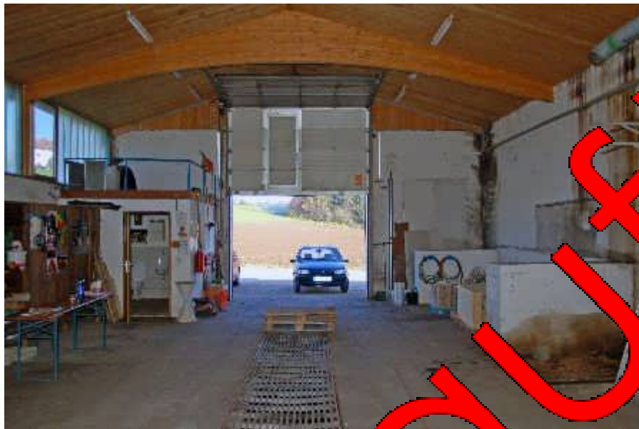
Halle mit Rolltor