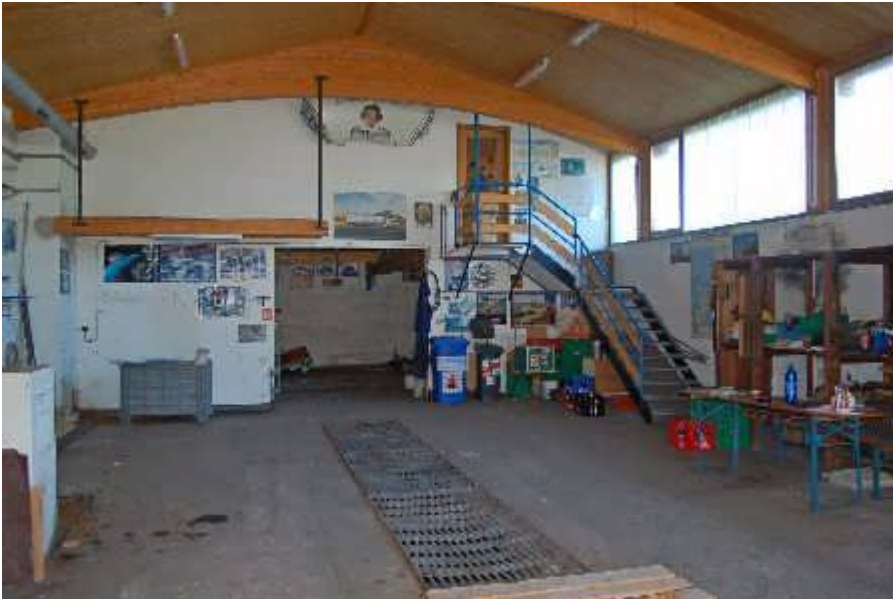
Halle mit Montagegrube